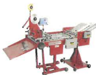
MOLLTI TAPER SYSTEM